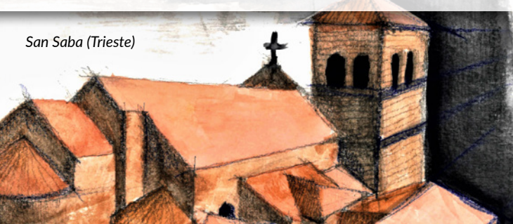
San Saba (Trieste)