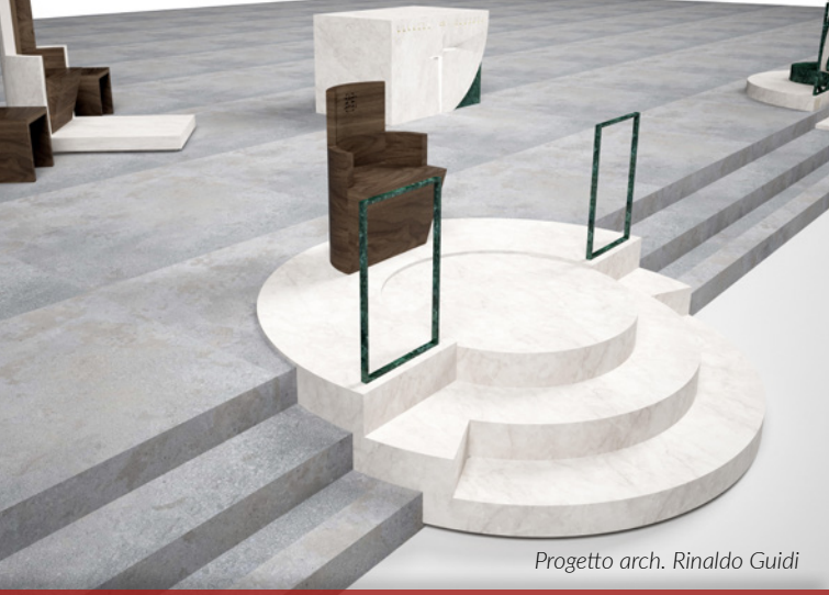
Progetto arch. Rinaldo Guidi