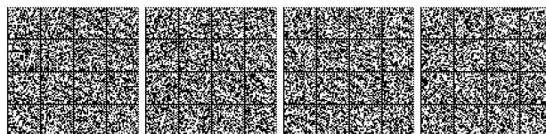
Tabella V.14-2: Compartimentazione