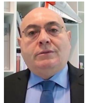
Sergio Clarelli Studio di ingegneria economica e ambientale