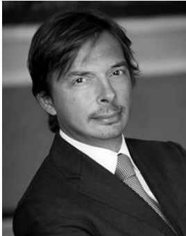
Federico Peres Studio B&P Avvocati