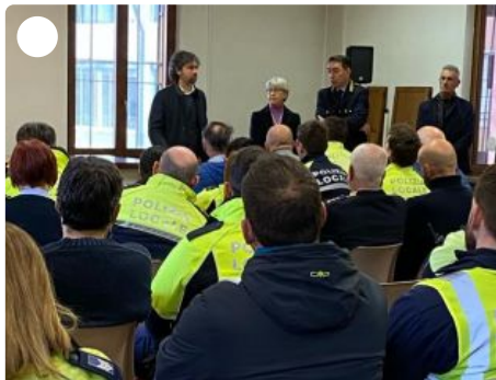
Gli auguri del sindaco e dell'assessore al personale della Polizia locale