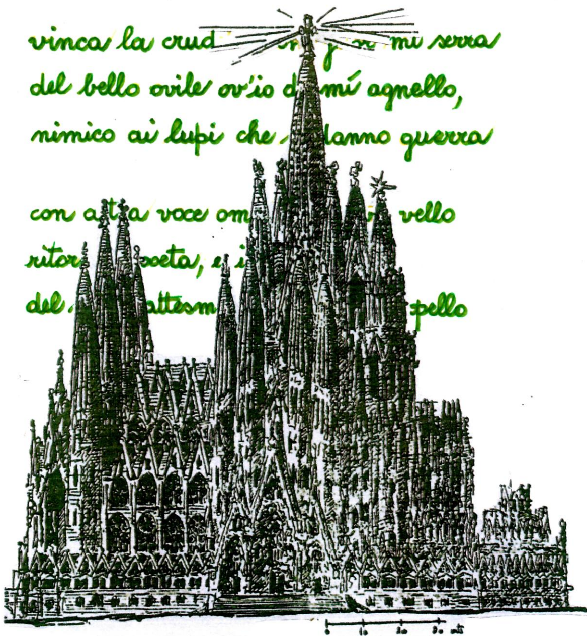
EL SOMNI REALISAT